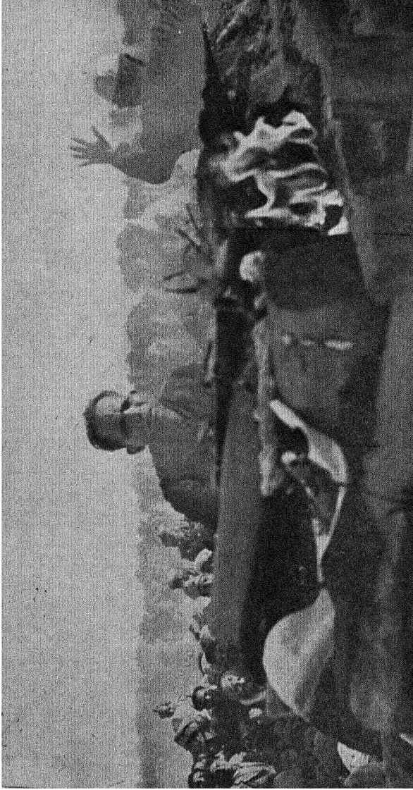
बापू का अग्नि-संस्कार